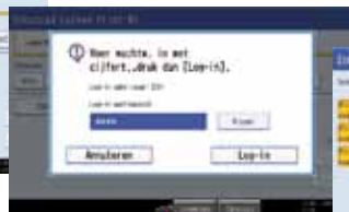
Type uw paswoord