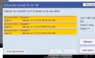
Druk de geselecteerde printertaken af.